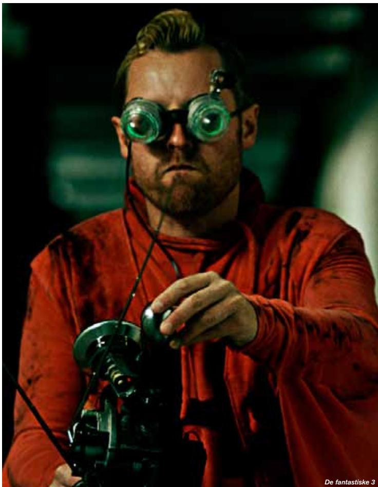
De fantastiske 3

For de lidt større børn viser vi filmen De fantastiske 3 om den fantasifulde Kasper, der gør sin far til superhelt, selvom han arbejder i Borgerservice.