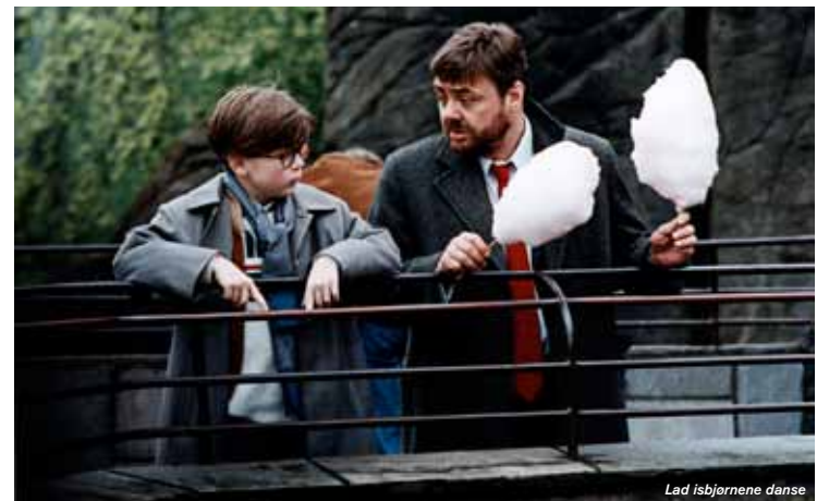
Lad isbjørnene danse