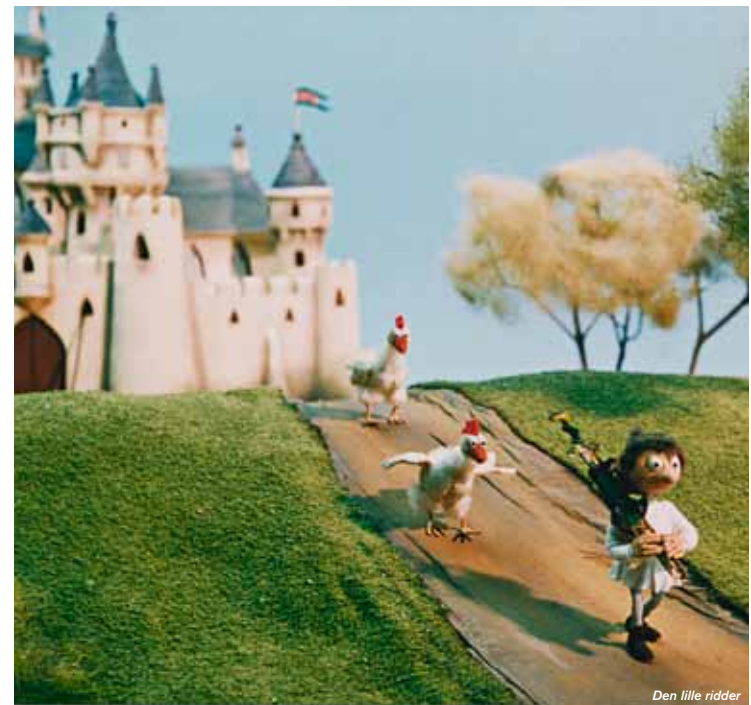
Den lille ridder