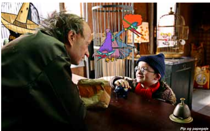
Pip og papegøje

Tobias' største ønske er at få en fugl, så da han en dag redder en syg spurv, smugler han den med hjem. Den viser sig at være Den Blinde Fe, og som belønning får Tobias et ønske opfyldt. Desværre er Den Blinde Fe virkelig dårlig til at trylle, og Tobias bliver ved en fejl forvandlet til en grøn papegøje. Hvis ikke Tobias bliver tryllet om, inden der er gået 29 timer, vil han forblive papegøje for evigt.