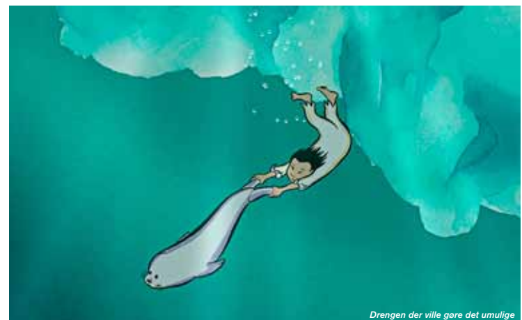
Drengen der ville gøre det umulige