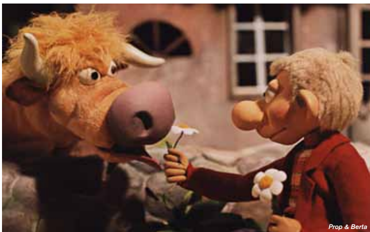
Prop & Berta