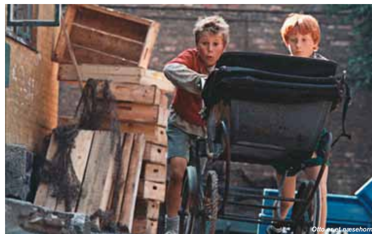
Otto er et næsehorn