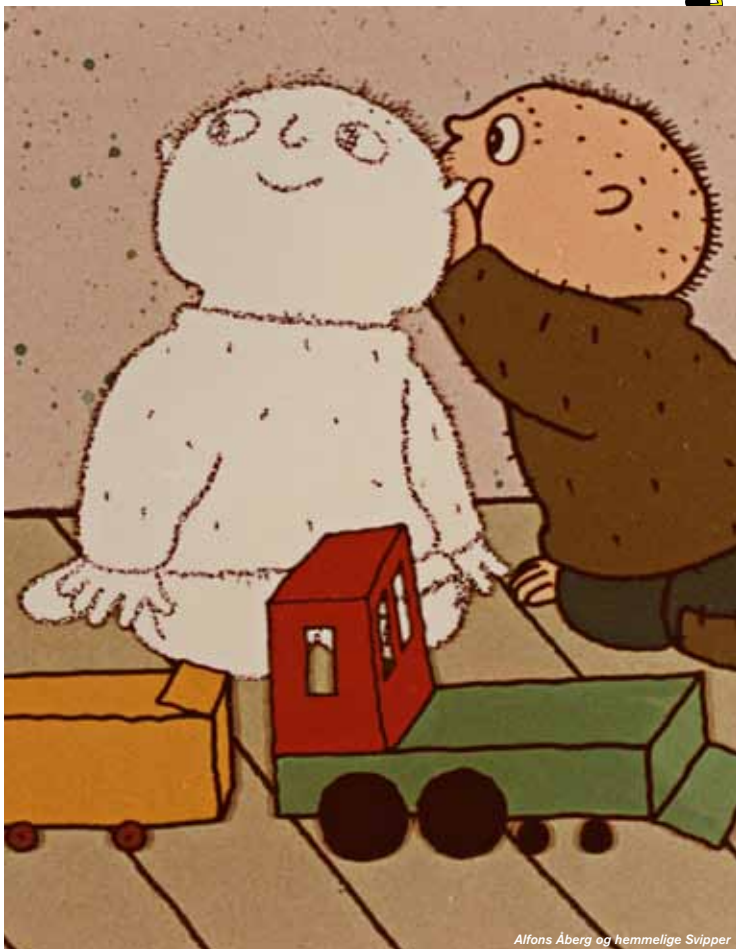
Alfons Åberg og hemmelige Svipper