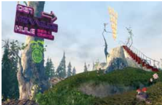
'Den standhaftige tinsoldat' Animationsbaggrund / A4 Figurer og rekvisitter / naturlig størrelse

Figurer og rekvisitter: to identiske hunde, et stort kødben.