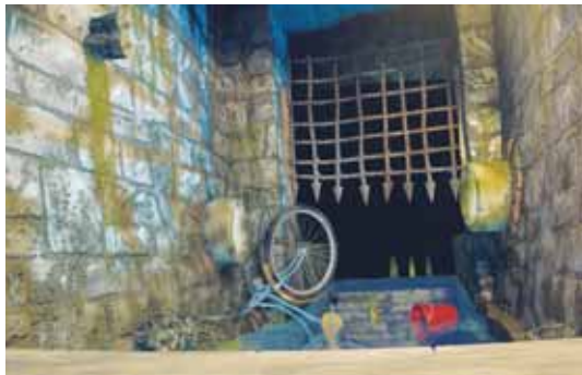
'Den standhaftige tinsoldat' Animationsbaggrund / A4 Figurer og rekvisitter / naturlig størrelse

Figurer og rekvisitter i FILM-X: tinsoldat, rotte, avisbåd.