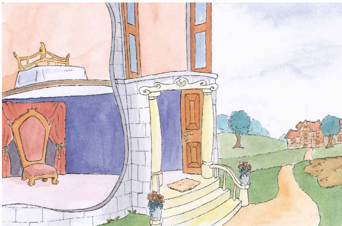
Slotsbaggrund til egne figurer / A4