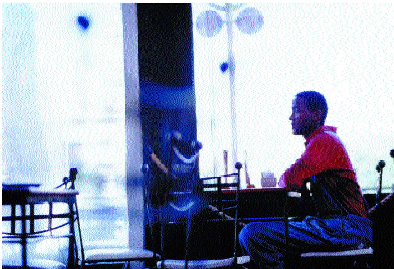
Steps for the Future.