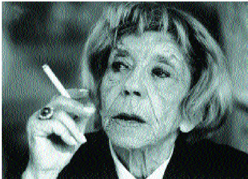
Danske piger viser alt, Tobak.