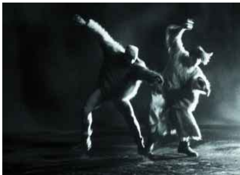
Jacob's Dream.

Nordisk Dans for Kamera er den foreløbige titel på en serie korte, nordiske dansefilm, der forener det visuelle og bevægelsen. Serien bliver til i et samarbejde mellem fem nordiske producenter (Barok Film fra Danmark), og det er tanken, at der i alt skal produceres 10 film - to fra hvert land - med en varighed på fem minutter hver.