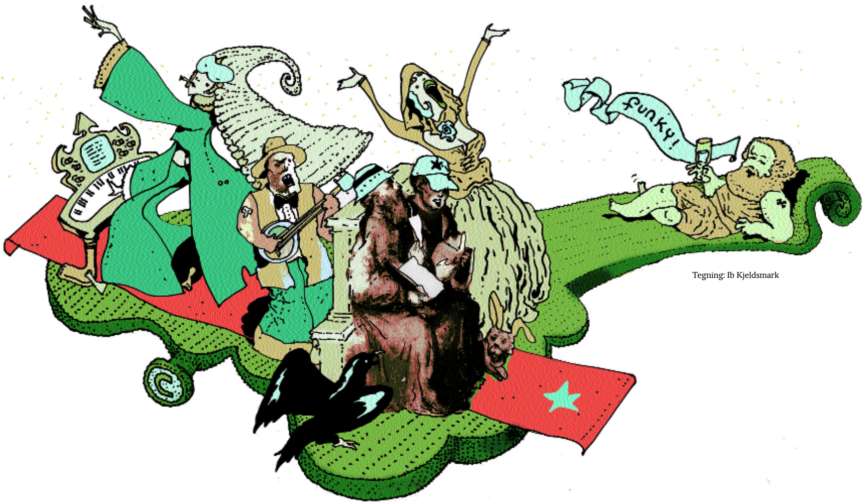
Tegning: Ib Kjeldsmark

(forskellen mellem det beløb, som filmproducenten indbetaler til NCB, og det beløb, som autoren får udbetalt) og ønsker derfor ikke at lade en del af disse beløb gå deres næse forbi. I NCB's søsterorganisation i Sverige har autorerne mulighed for selv at disponere over synkroniseringsvederlaget. I NCB Danmark findes en sådan undtagelsesbestemmelse ikke. I enkelte tilfælde har NCB Danmark dog accepteret, at autoren giver afkald på synkroniseringsvederlaget, men administrationsbidraget til NCB skal stadig betales, og det må anses for usikkert, om det er muligt at påberåbe sig denne praksis.