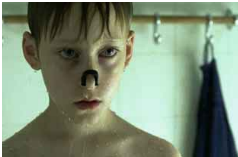
2 minutter.