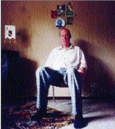
Bare en lille snak.

TO FILM OM ENSOMHED OG LÆNGSEL 36 min. Sverige, 1996-97 / Instr. Lukas Moodysson, Marcelo Racana / Prod. AB Memphis Film & Television, Such Much Movies