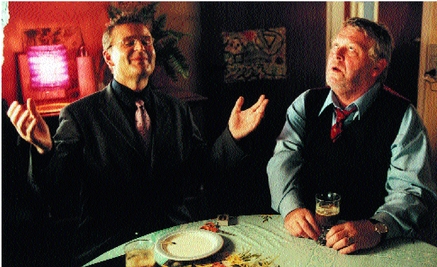
At klappe med en hånd. Foto: Thomas Petri

Kilde: Det Danske Filminstitut / Tal for andre danske film findes på www.dfi.dk