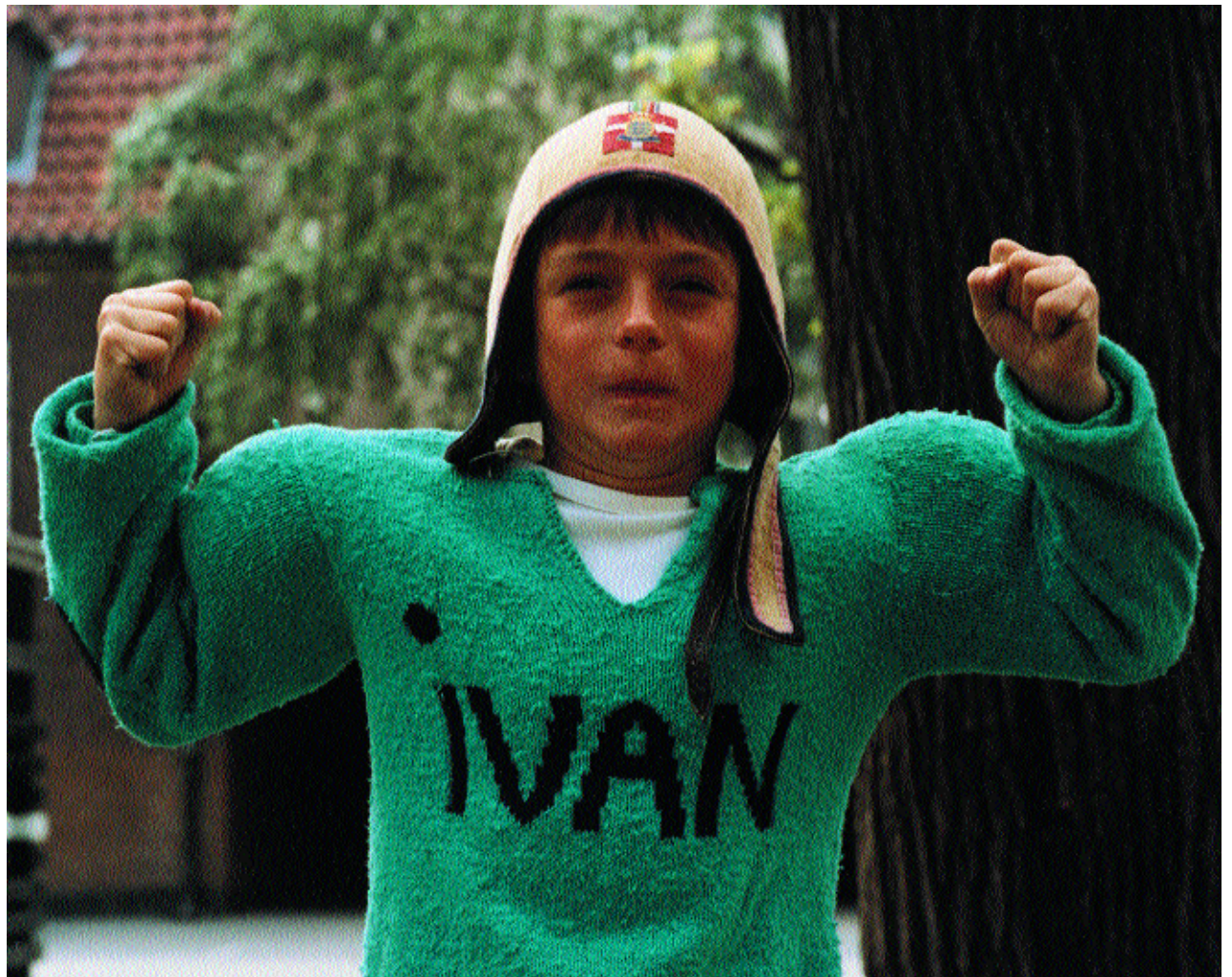
Gummi Tarzan.

50-års-jubilæren Danske Børne- og Ungdomsfilmklubber (DaBUF) satser på at gøre biografoplevelsen speciel - også for næste generations børn.