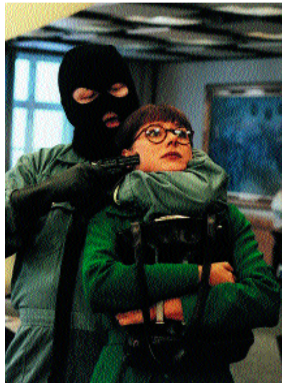
Monas verden.

Måske er co-branding vejen frem, men intet er sikkert. Hvis websitet til Monas Verden ikke virker som et kampagnesite, kan det være fordi, det ikke er et kampagnesite. Et gennemsnitligt filminteresseret menneske bruger ikke kræfter på at designe en