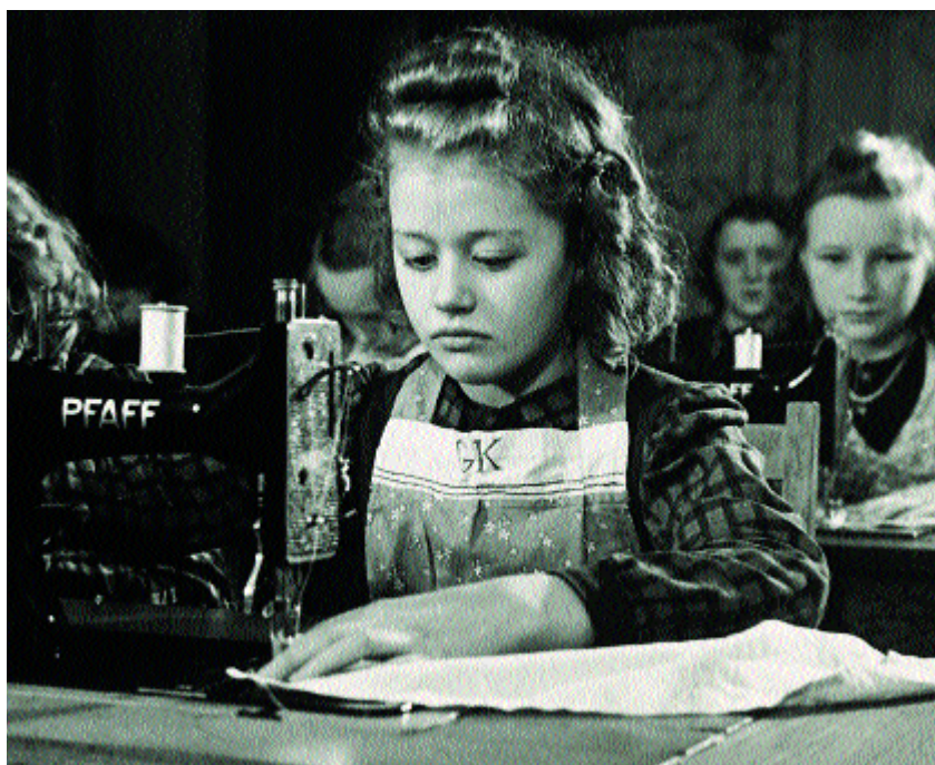
Denmark Grows Up.

FILM FRA BESÆTTELSESTIDEN PÅ NETTET I VISIONÆR WEB-FORTÆLLING FOR BØRN