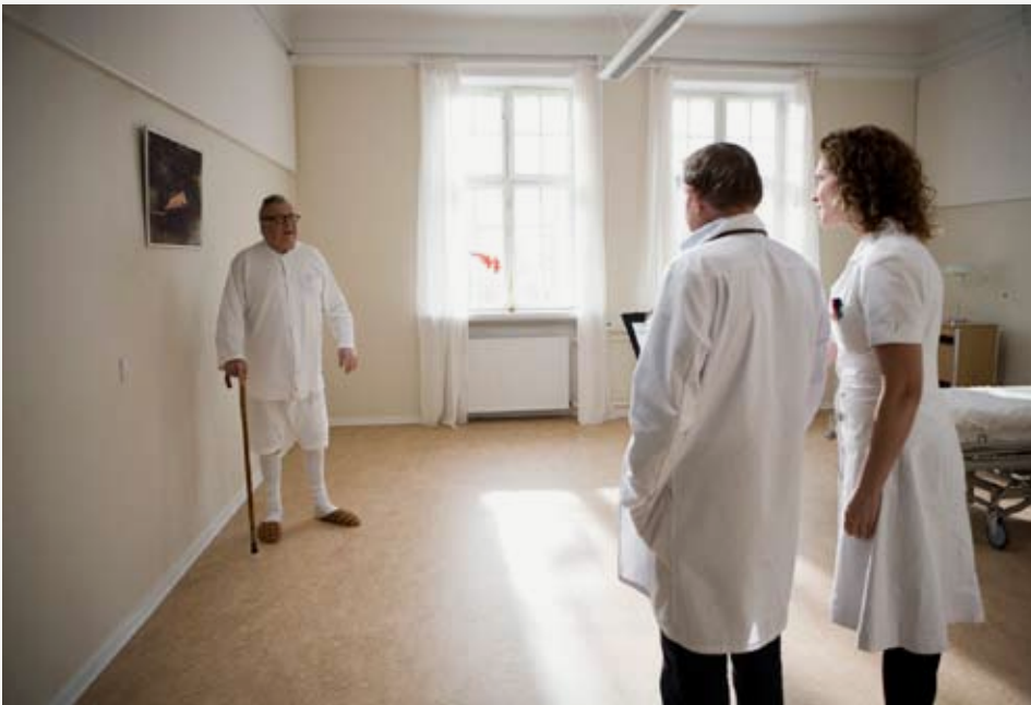
'Grisen', kortfilm af Dorte W. Høgh.