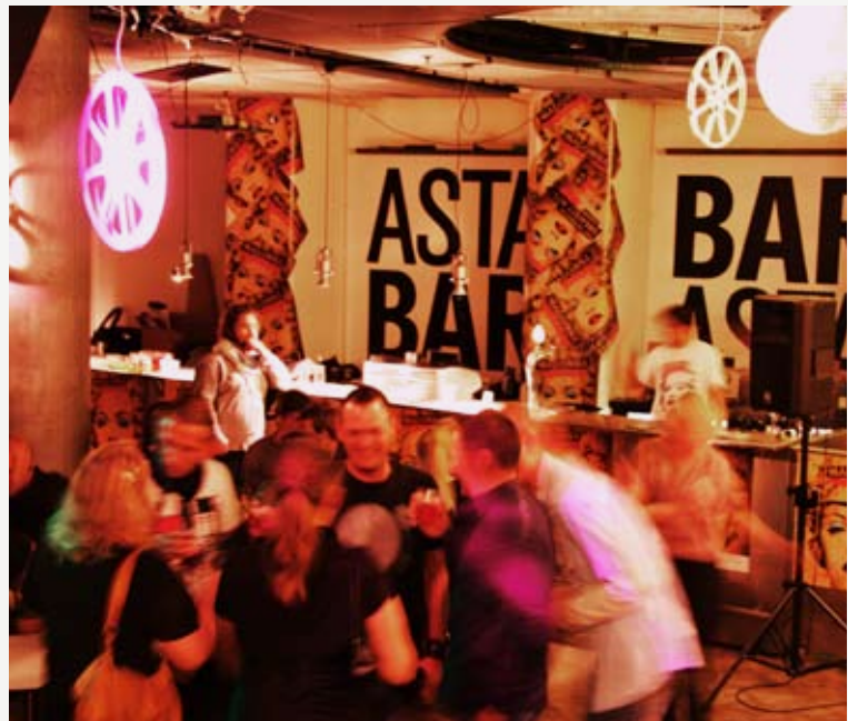
Filmhuset åbnede dørene – og gaderne omkring – til en velbesøgt Kulturnat i 2009.