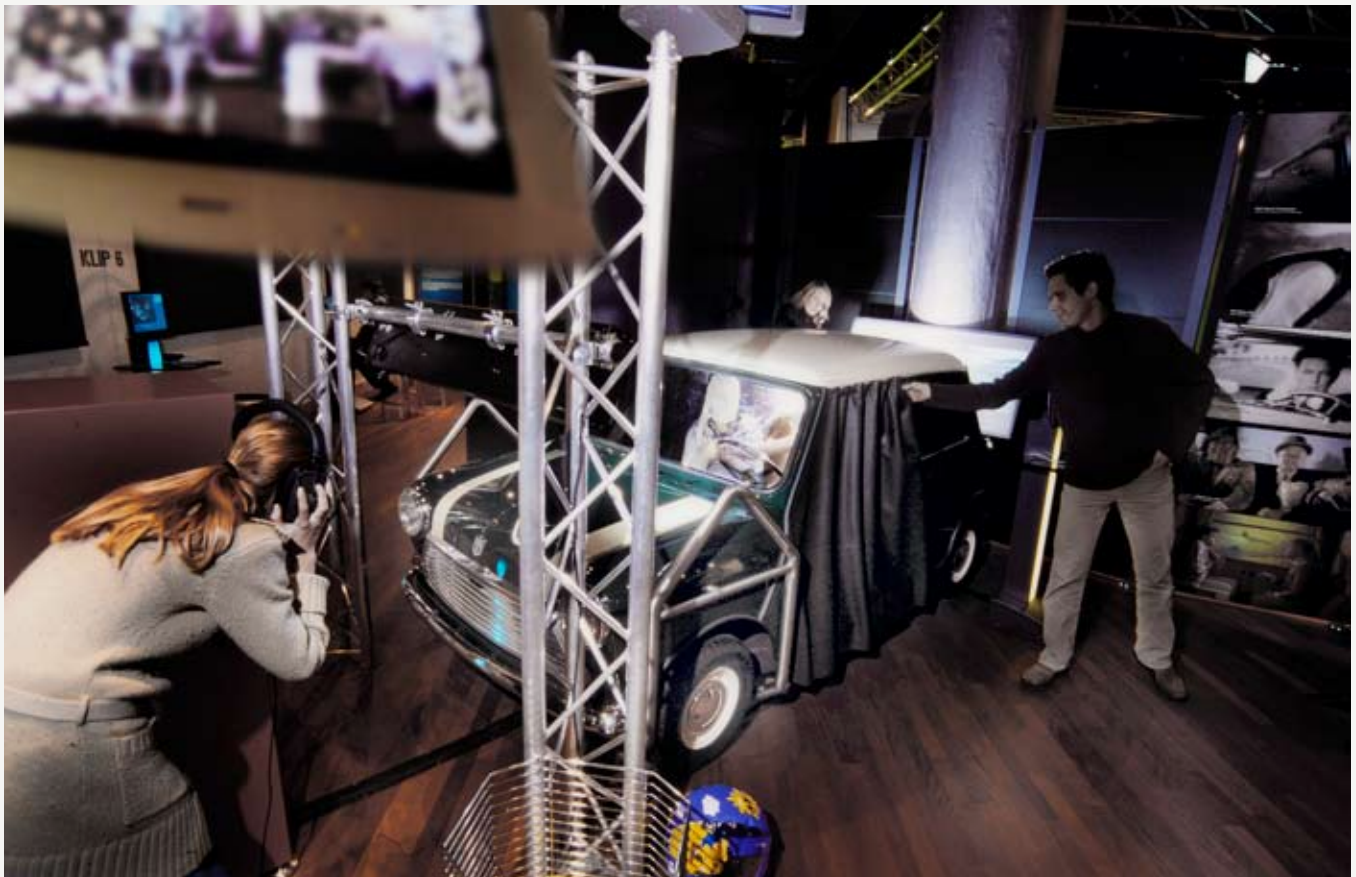
En af de centrale kulisser i FILM-X er en Morris Mascot til at optage biljagter. Det interaktive filmstudie har været en enorm succes blandt både skoleklasser og private siden åbningen i 2002.