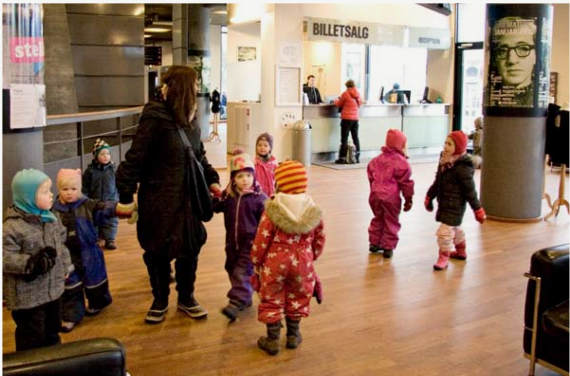
Børnehavebørn på vej til en af de daglige visninger i 'Børnebiffen' i Filmhuset.