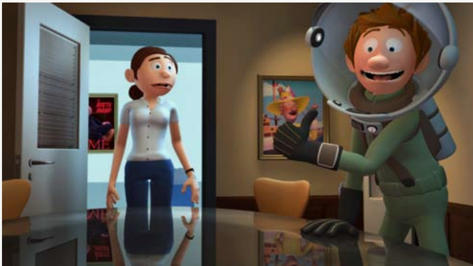
'Rejsen til Saturn' af Craig Frank, Thorbjørn Christoffersen, Kresten Vestbjerg Andersen. Framegrab