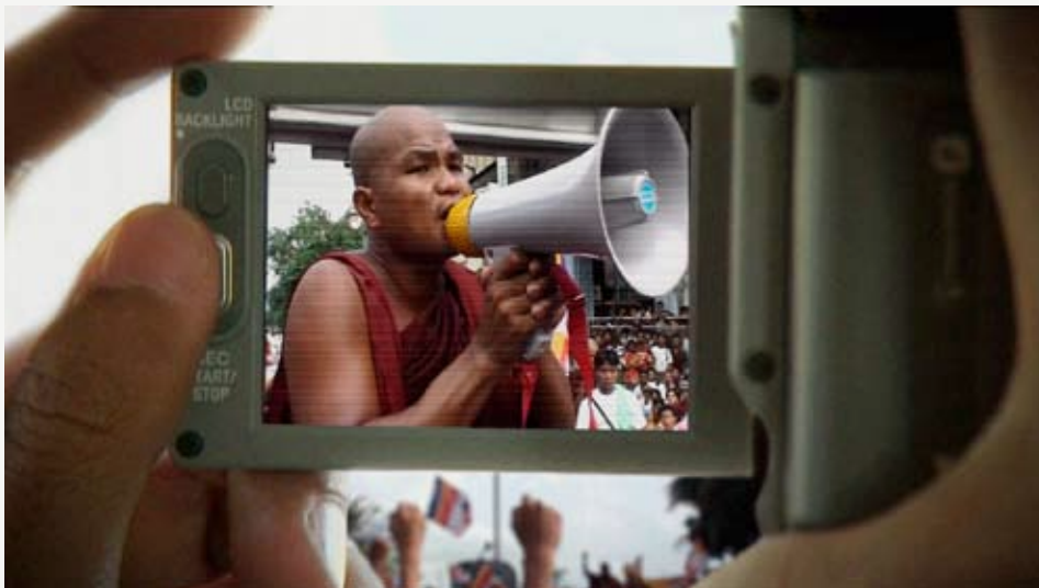
'BURMA VJ – Reporter i et lukket land' af Anders Østergaard. Framegrab