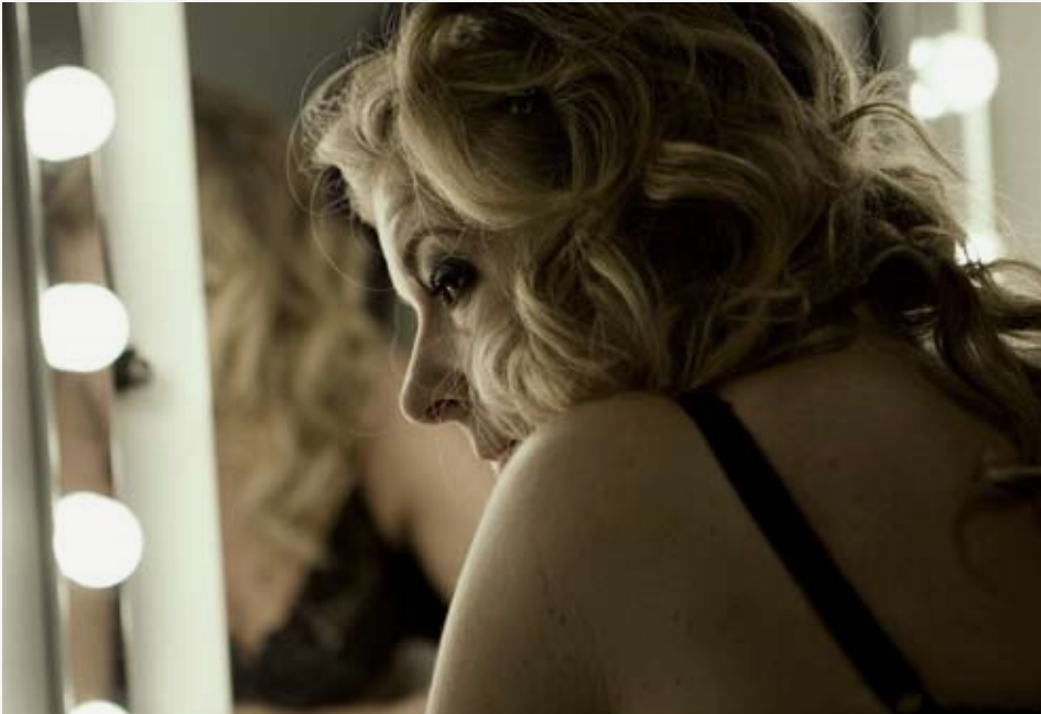
'Applaus', spillefilm af Martin Pieter Zandvliet.