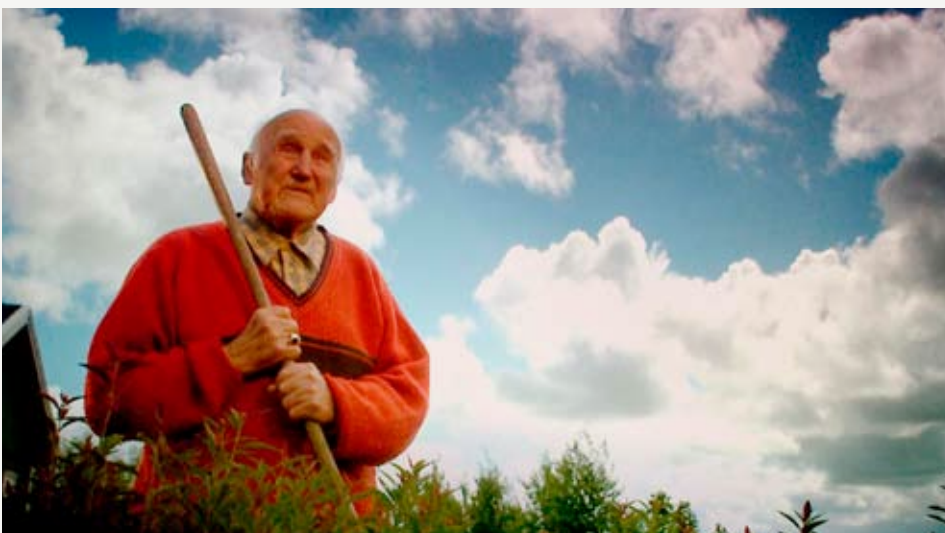
'Side om side', dokumentarfilm af Christian Sønderby Jepsen.