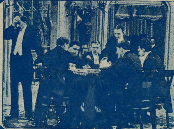
»For Ærens Skyld.«