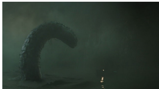
SØSLANGE OG BÅD TOTAL