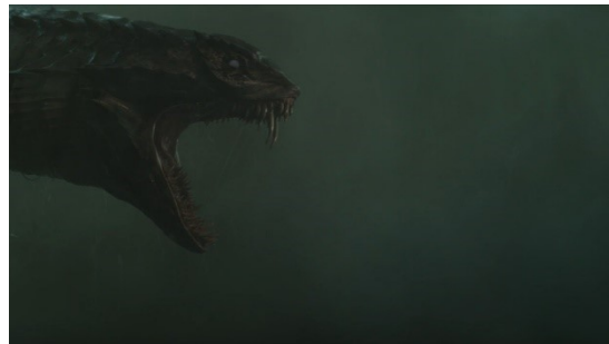
SØSLANGE I PROFIL 2