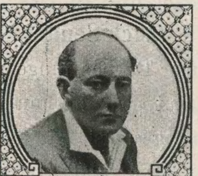
Cecil B. de Mille ARTCRAFT