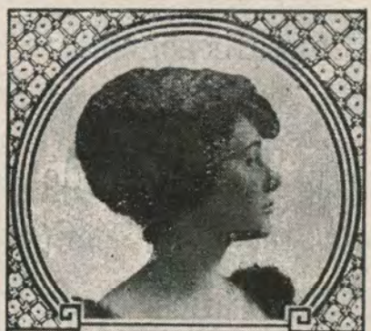
Elsie Ferguson ARTCRAFT

Det er ikke det, De betaler for en Film, der altid tæller, det er hvad Filmen indbringer Dem.