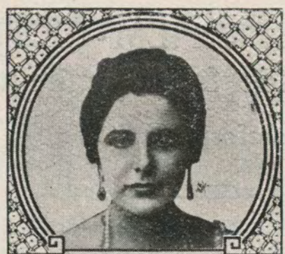
Geraldine Farrar ARTCRAFT