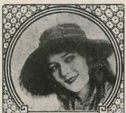
Mary Pickford ARTCRAFT