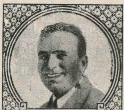
Douglas Fairbanks ARTCRAFT