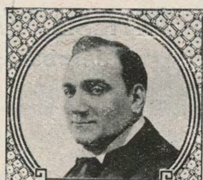
Enrico Caruso ARTCRAFT