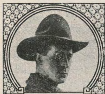
Wm. S. Hart ARTCRAFT