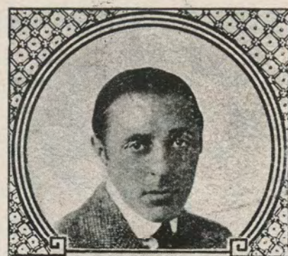
D.W. Griffith ARTCRAFT