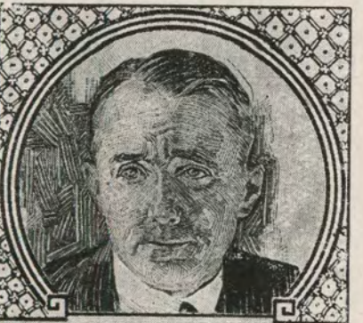
George M. Cohan ARTCRAFT