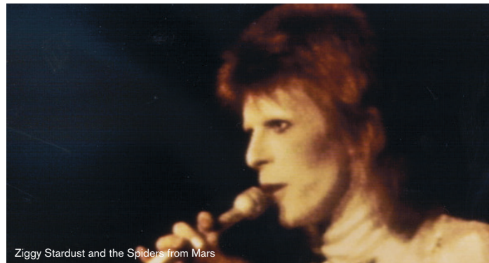
Ziggy Stardust and the Spiders from Mars

London, juli 1973. David Bowie giver sit sidste show – som Ziggy Stardust. D.A. Pennebakers koncertfilm er spækket med hits fra Bowies tidlige plader samt intense backstage-optagelser. Vis evt. filmen med introduktion af Bowie-ekspert Jan Poulsen. (NB begrænset bookingperiode: 1.jan.-30. juni 2017).