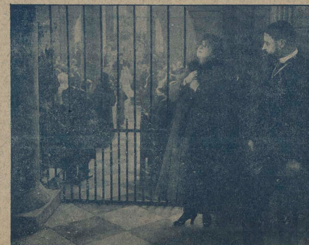
Af „Kærlighedens Lænker“