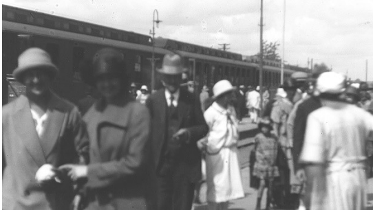
FOLK PÅ PERRON

Nedenfor kan du se de ekstra klip, der findes til Kupéen 1940 .