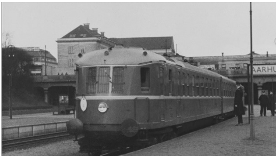
TOG AFGÅR – SET FRA PERRON