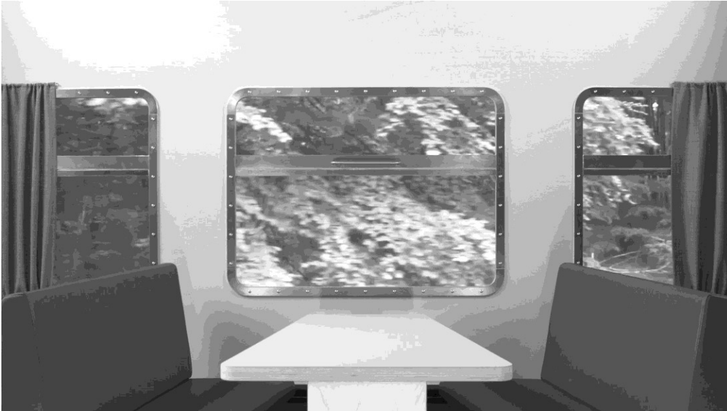
Studieoptagelse med Kupéen - 1940

I sidder i en kupé i et tog, der kører gennem en skov og ender på en station i et affolket område. Filmen er sort/hvid og I kan sætte ægte arkivoptagelser ind i jeres film, så handlingen føres langt tilbage i tiden til ca. 1940.