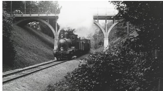
TOG UNDER BRO