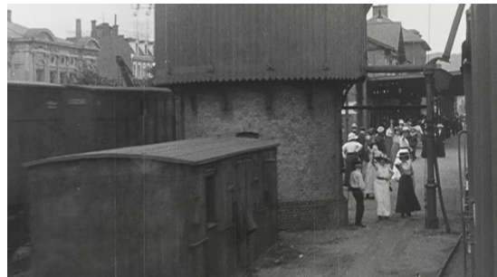
TOG AFGÅR – SET FRA TOG