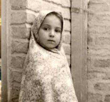
Mit iranske paradis , Foto: Stinx Film 69.000 € i TV Broadcaststøtte