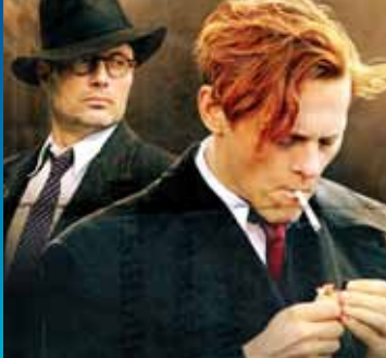
Flammen & Citronen , Foto: Nimbus Film MEDIA Slate funding