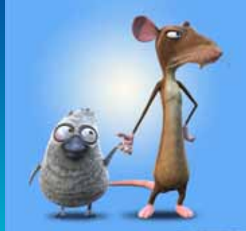
Den grimme sølling og mig, Foto: A-Film MEDIA distributionsstøtte