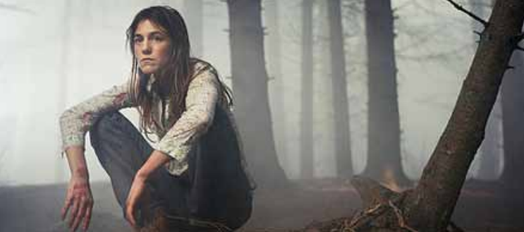
Antichrist, Foto: Christian Geisnæs. i2i støtte på 50.000 €