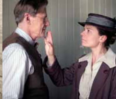
Maria Larssons evige øjeblik Slate funding til Final Cut Productions