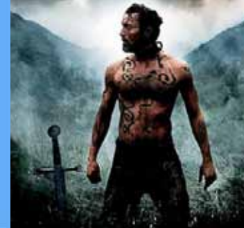
Valhalla Rising, Foto: Dean Rogers i2i støtte på 50.000 €